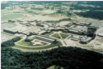
Konzernzentrale DaimlerChrysler, Auburn Hills, U.S.A.

DaimlerChrysler trägt als global tätiger Automobilkonzern weitreichende Verantwortung. An der Herstellung und dem Vertrieb unserer Produkte sind weltweit mehrere hunderttausend Menschen beteiligt. Unsere Fahrzeuge finden sich in fast allen Ländern der Erde. Sie befriedigen das Bedürfnis der Menschen nach Mobilität und bieten flexible Transportmöglichkeiten für Güter. Damit bilden sie die Grundlage für individuelle Beweglichkeit und Unabhängigkeit und stellen eine wichtige Basis einer modernen Gesellschaft und Volkswirtschaft dar. Zugleich beanspruchen die Herstellung und die Nutzung unserer Fahrzeuge die natürlichen Ressourcen, und unsere Geschäftstätigkeit beeinflusst die Gesellschaft auf vielfältige Weise.