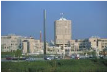
Konzernzentrale DaimlerChrysler, Stuttgart, Deutschland

DaimlerChrysler trägt als global tätiger Automobilkonzern weitreichende Verantwortung. An der Herstellung und dem Vertrieb unserer Produkte sind weltweit mehrere hunderttausend Menschen beteiligt. Unsere Fahrzeuge finden sich in fast allen Ländern der Erde. Sie befriedigen das Bedürfnis der Menschen nach Mobilität und bieten flexible Transportmöglichkeiten für Güter. Damit bilden sie die Grundlage für individuelle Beweglichkeit und Unabhängigkeit und stellen eine wichtige Basis einer modernen Gesellschaft und Volkswirtschaft dar. Zugleich beanspruchen die Herstellung und die Nutzung unserer Fahrzeuge die natürlichen Ressourcen, und unsere Geschäftstätigkeit beeinflusst die Gesellschaft auf vielfältige Weise.